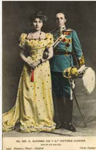
Alfonso XIII y Ena.