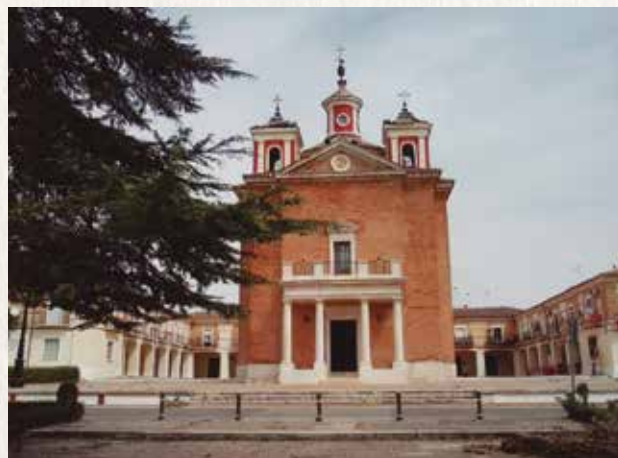
San Isidro Labrador.