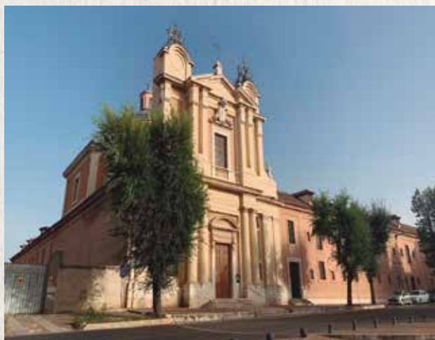
San Pascual Bailón.