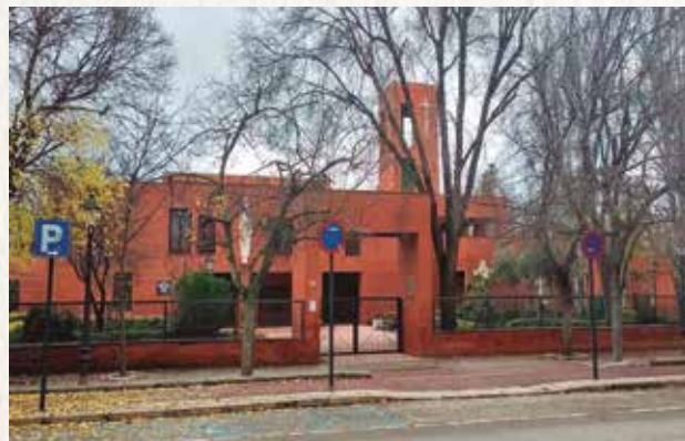
Del Espíritu Santo.

zona de “la Montaña”, los Cortijeros nos quedaremos con el histórico edificio Religioso, nuestra querida Iglesia, más radiante, pero más solitaria, porque echaremos de menos esa alegría, extensible al resto del Pueblo como consecuencia de mayor número de Bodas, Bautizos, Misas, Catequesis, Comuniones y, sobre todo, sin el bullicio de la Misa de los .niños... con su repicar de las campanas