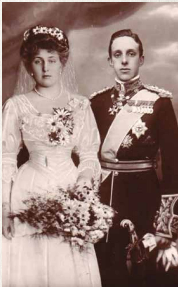
Alfonso XIII y Victoria Eugenia.

«Una densa y jubilosa muchedumbre en la Puerta del Sol de Madrid. Penosamente avanzaban entre los torrentes humanos dos automóviles. En el primero van Miguel Maura y Largo Caballero; en el segundo, Lerroix, Fernando de los Ríos, Marcelino Domingo y Álvaro de Albornoz. Eran el Gobierno provisional de la República, [que] acababa de nacer».