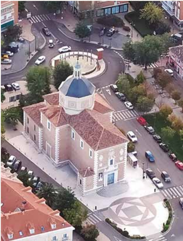
Nuestra Señora de las Angustias (Alpañés).

Esta nueva Comunidad Religiosa Parroquial, tiene una especial singularidad: -1º Doble Patronazgo , San Rafael