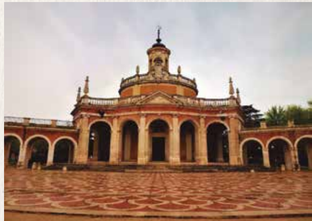
San Antonio de Padua.